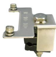
オプション 「D/SC」支持線取付金具