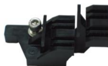
A0 用ドロップ把持具