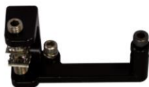
A0 用 TM 把持金具