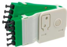
1x4 スプリッタモジュール (UPC (上)、APC (下))