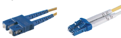
SCF コネクタ(SCF) LC コネクタ(DXLC)