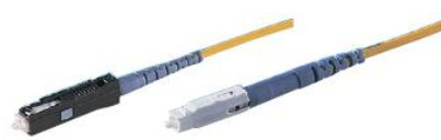
MU コネクタ MUJ コネクタ *着脱には専用工具が必要になります。