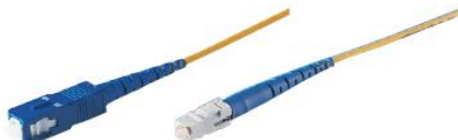
SC コネクタ SC2 コネクタ *着脱には専用工具が必要になります。