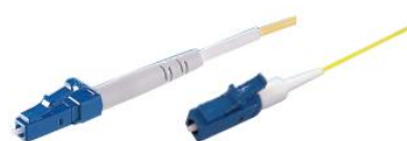
コードタイプ 心線タイプ