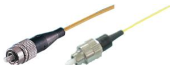
コードタイプ 心線タイプ